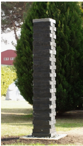
Wassersäule (2008) Maggia Gneis

Geboren 1951 in Stans. Bildhauerausbildung in Luzern; eidgenössische Matura; Studien in Physik und Philosophie an der Universität Bern; seit 1979 freischaffender Bildhauer; seit 1982 regelmässige Ausstellungen im In- und Ausland; seit 1985 Atelier in der «Fabrik» in Burgdorf; seit 1998 Atelier in Berlin, diverse Werke in privaten und öffentlichen Sammlungen, sowie im öffentlichen Raum. Seit 2000 Leitung diverser Weiterbildungskurse im Steinbildhauen an der Scuola di Scultura di Peccia.