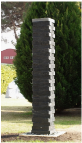
Wassersäule (Collona d'acqua) (2008) Gneiss della Vallemaggia

Nato nel 1951 a Stans. Formazione quale scultore a Lucerna. Maturità federale. Studi di fisica e filosofia all'Università di Berna. Dal 1979 scultore in proprio. Dal 1982 espone regolarmente in Svizzera ed all'estero. Dal 1985 ha atelier nella "Fabrik" di Burgdorf; dal 1998 ha atelier a Berlino. Diverse sue opere in collezioni pubbliche e private o in spazi pubblici. Dal 2000 docente, per diversi corsi di perfezionamento WBK, presso la Scuola di Scultura di Peccia.